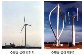
수직형 풍력 발전기 수평형 풍력 발전기

풍력발전은 공기의 흐름이 가진 운동에너지 특성을 이용하여 회전자(Rotor)를 회전시켜 기계적 에너지로 변환시키고 이 기계적 에너지로 전기를 생산하는 기술을 말합니다.